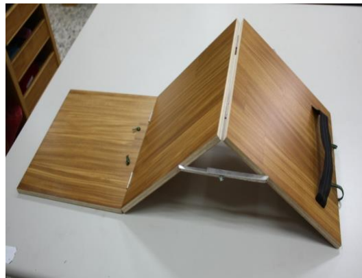
圖 4 仰臥起坐運動輔助器