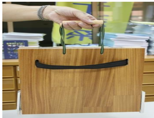
圖 4 可攜式仰臥起坐運動輔助器收納